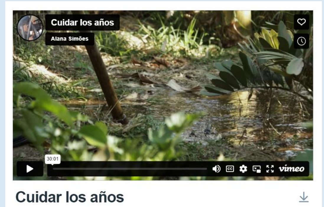
Cuidar los años